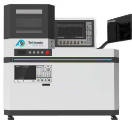
DPT1000A 功率器件动态参数测试系统