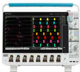
5 系列 B MSO 混合信号示波器