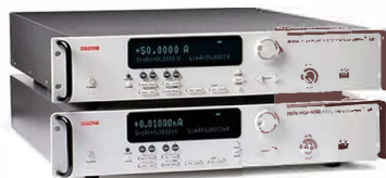
Keithley SMU 2650 系列高功率 SourceMeter®