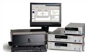
Keithley PCT 参数波形记录仪