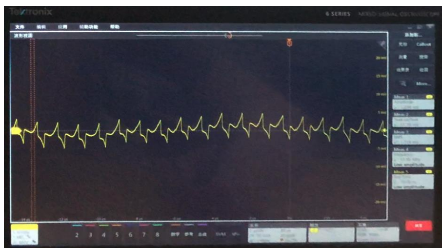
图 4：PWM 模式的纹波