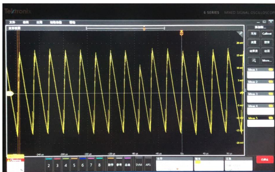
图 3：PFM 模式的纹波

我们不难发现，相比 PWM 模式，PFM 模式下，电源的纹波是明显大的，这和 datasheet 的描述是一致的。